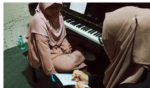
Gambar 1. Proses pengenalan Notasi Musik menggunakan metode ceramah

Materi pengenalan notasi dalam bermain piano diajarkan melalui metode ceramah oleh instruktur. Penjelasan mencakup simbol-simbol notasi balok, termasuk bentuk, nilai, staff, dan notasi natural, serta materi fingering yang meliputi penomoran jari dan posisi tangan. Instruktur menggunakan kertas dan gambar untuk memudahkan pemahaman, dengan siswa menuliskan nomor jari mereka sendiri. Untuk skala nada, penjelasan dilakukan secara rinci menggunakan buku yang disediakan. Pada materi sight reading, meskipun ceramah digunakan untuk mengoreksi kesalahan, fokus lebih pada praktik membaca cepat dan bahan.