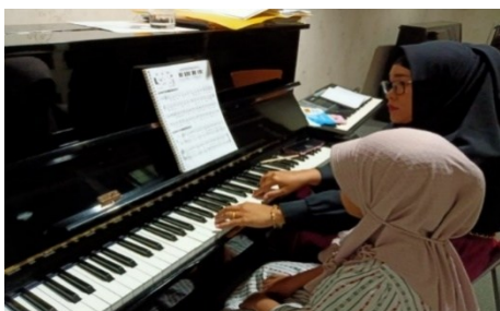
Gambar 2. Instruktur mendemonstrasikan materi dengan kedua tangan.

notasi. Namun, pada materi fingering , instruktur sering menggunakan demonstrasi untuk menunjukkan posisi jari di piano agar siswa dapat mengaplikasikannya dengan mudah. Pada materi scale , metode demonstrasi juga digunakan untuk mempercepat pemahaman siswa, di mana instruktur menunjukkan perlahan cara memainkan scale dan siswa menirukan. Jika siswa belum paham, instruktur mengulang not demi not. Pada materi sight reading , instruktur mendemonstrasikan cara membaca dan memainkan partitur lagu secara perlahan, membantu siswa lebih mudah membaca simbol dan memainkan lagu.