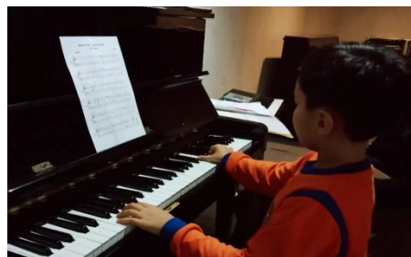
Gambar 4. Siswa berlatih dibimbing oleh instruktur

Pada materi pengenalan notasi balok, instruktur tidak menggunakan metode drill karena fokusnya pada teori dasar musik. Namun, pada materi fingering , metode drill efektif untuk meningkatkan keterampilan teknis siswa dalam ketepatan dan koordinasi jari. Instruktur menggunakan latihan berulang untuk memperkuat otot jari dan meningkatkan kecepatan serta akurasi bermain piano. Dalam materi scale , metode drill membantu membangun fondasi teknik bermain dengan melatih skala berulang-ulang, meningkatkan ketepatan, kecepatan, dan mengenali pola-pola dalam musik. Pada sight reading , metode drill mempercepat kemampuan membaca notasi dengan meningkatkan kecepatan pengenalan not dan simbol musik, membantu siswa bermain lebih lancar dan tanpa henti.