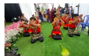
Gambar 4. Gerak Sembah