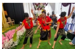
Gambar 1. Gerak Menyembah

yaitu menghentak-hentakkan kaki. Kumantan menari diikuti penari-penari dibelakangnya. Gerak Tari Rentak Bulian terdiri dari 7 ragam gerak, antara lain: Gerak Menyembah, Gerak Merentak, Gerak Goyang Pucuk, Gerak Sembah, Gerak Meracik Limau, Gerak Merenjis Limau (Memercik Limau) dan Gerak Empat Penjuru.