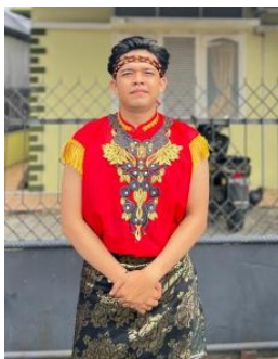
Gambar 15. Kostum Laki Laki

dalam Desfiarni, 2008: 34). Kostum laki-laki menggunakan baju gomoh, celana gomoh, ikat pinggang gomoh, ikat kepala gomoh dan kerincing kaki dan kostum perempuan menggunakan baju kumantan, rok kumantan, jurai pengobatan pandan dan kerincing kaki.