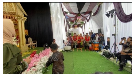
Gambar 17. Tempat Pertunjukkan Tari Rentak Bulian

Menurut Murgiyanto (1995) Seni pertunjukkan merupakan sebuah nontonan yang memiliki nilai seni dimana tontonan tersebut disajikan sebagai pertunjukkan didepan penonton. Sal Murgiyanto juga mengatakan bahwa kajian pertunjukkan adalah sebuah disiplin baru yang mempertemukan ilmu-ilmu seni (musikologi, kajian tari, kajian teater) di satu titik antropologi di titik lain dalam satu kajian inter-disiplin.