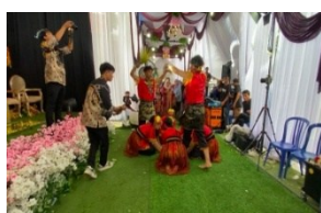
Gambar 3. Gerak Goyang Pucuk Gambar