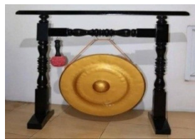
Gambar 9. Gong