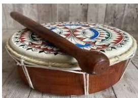
Gambar 10. Tambur