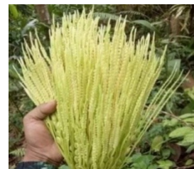
Gambar 14. Mayang Pinang

Properti merupakan salah satu unsur dalam tari digunakan sebagai alat untuk mengapresiasi gagasan dalam tari, serta menghasilkan desain gerak yang estetik. Desfiarni dan Fuji (2021:243) properti yang digunakan pada penampilan Tari Rentak Bulian adalah Mayang Pinang yang melambangkan keagungan, sikap bertanggung jawab, dan pembentengan para gading-gading. Mayang pinang adalah merupakan salah satu perlengkapan upacara pengusiran roh jahat dan ritual penyembuhan.