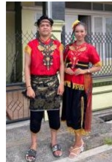
Gambar 13. Foto Penari Rentak Bulian

orang penari perempuan dara yang sudah baliq dalam keadaan suci dan bersih.