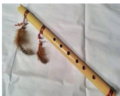
Gambar 8. Suling

Musik adalah cabang seni yang membahas dan menetapkan berbagai suara ke dalam pola-pola yang dapat dimengerti dan dipahami manusia (Banoë, 2003:288). Sedangkan menurut Jamalus (1988:1) musik adalah suatu hasil karya seni bunyi dalam bentuk lagu atau komposisi musik, yang mengungkapkan pikiran dan perasaan penciptanya melalui unsur-unsur musik, yaitu irama, melodi, harmoni, bentuk /struktur lagu dan ekspresi sebagai satu kesatuan. Alat musik yang digunakan untuk mengiringi Tari Rentak Bulian adalah suling, gong, tambur, gendang panjang dan ketuk-ketuk.