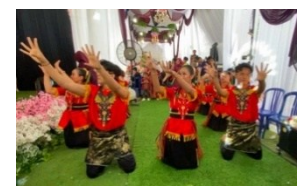
Gambar 6. Gerak Merenjis Limau