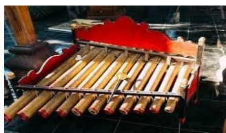
Gambar 12. Ketuk-ketuk