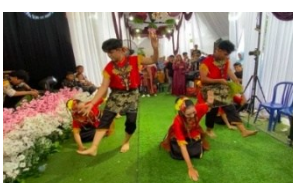
Gambar 7. Gerak Empat Penjuru