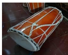
Gambar 11. Gendang Panjang