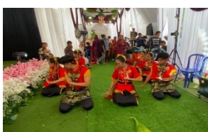
Gambar 5. Gerak Meracik Limau