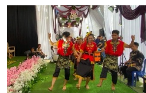
Gambar 2. Gerak Merentak