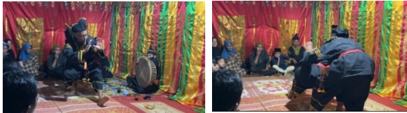
Gambar 1. Gerak Sambah

dilakukan kembali dalam bagian-bagian tertentu. Sebelum penari menampilkan tarian sudah disusun 6 helai papan yang ditutupi dengan tikar. Pada awal tari penari bersalaman dengan Masyarakat dan niniak mamak , kemudian mulai melakukan Gerak Pasambahan , Rentangkan tangan , Pilin kirok tangan , Kirok alang tabang manjalang gunuang , Buruang tabang duo , Titih batang dan Hentak gajah babuni .