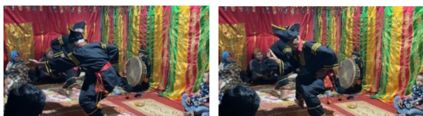
Gambar 6. Gerak Titih Batang

Posisi tubuh sedikit membungkuk, kaki sedikit rendah, kedua lengan tangan dibuka ke samping menyerupai sayap. Gerakan tangan lembut naik-turun. Kaki melangkah dan berputar kecil sampai berpindah tempat. Kemudian gerakan selanjutnya tangan kanan terentang ke samping dalam posisi siap, sementara tangan kiri berada sedikit di depan tubuh, lanjut tangan kanan menghadap ke samping dengan jari-jari terbuka. gerakan tangan saling terbuka dan posisi tubuh saling berhadapan. Gerakan dilakukan 2 kali pengulangan dengan hitungan pelan 2 x 8, gerakan menginjit-injit tangan menyesuaikan dengan kaki. Selesai melakukan gerak buruang tabang duo manjalang gunuang dilanjutkan di ulangi gerakan di atas Gerakan Pilin Kirok Tangan.