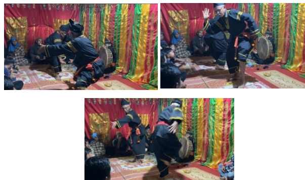
Gambar 7. Gerak Hentak Gajah Babuni

Posisi tubuh merendah, lutut sedikit ditekuk, tubuh sedikit condong ke depan untuk menjaga keseimbangan. Langkah kaki kecil seolah berjalan di atas batang yang sempit, tumit tidak menapak penuh, ujung kaki menjadi titik tumpuh untuk menahan. Kedua tangan direntangkan ke samping atau ke depan-belakang tangan di kepal kemudian di buka seperti orang menjaga keseimbangan gerak. Gerakan berulang-ulang dengan hitungan pelan 4 x 8. Selesai melakukan Gerak Titih Batang dilanjutkan melakukan yang di atas Gerakan Gerak Pilin Kirok Tangan setelah gerakan di atas lanjut dengan gerak hentak gajah babuni