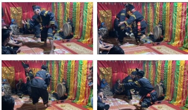
Gambar 5. Gerak Buruang Tabang Duo

Posisi tubuh sedikit membungkuk, kaki sedikit rendah, kedua lengan tangan dibuka ke samping menyerupai sayap. Gerakan tangan lembut naik-turun. Kaki melangkah dan berputar kecil sampai berpindah tempat. Kemudian gerakan selanjutnya tangan kanan terentang ke samping dalam posisi siap, sementara tangan kiri berada sedikit di depan tubuh, lanjut tangan kanan menghadap ke samping dengan jari-jari terbuka. gerakan tangan saling terbuka dan posisi tubuh saling berhadapan. Gerakan dilakukan 2 kali pengulangan dengan hitungan pelan 2 x 8, gerakan menginjit-injit tangan menyesuaikan dengan kaki. Selesai melakukan gerak buruang tabang duo manjalang gunuang dilanjutkan di ulangi gerakan di atas Gerakan Pilin Kirok Tangan.