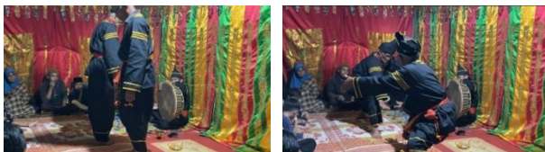
Gambar 2. Gerak Rentangkan Tangan

Gerak awal dilakukan dengan gerakan sambah penghormatan kepada tamu-tamu yang ada di lokasi acara pesta perkawinan, yang dilakukan dengan sikap sopan, dan penuh etika. Gerakan dilakukan dengan hitungan 1 x 8 ke arah kiri dan 1 x 8 ke kanan dengan hitungan pelan. Kemudian dilanjutkan dengan melakukan Gerakan Rentangkan Tangan.