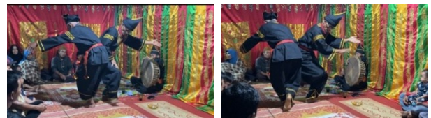
Gambar 4. Gerak Kirok Alang Tabang Manjalang Gnuang

Kedua penari dengan posisi tubuh sedikit rendah, lutut di tekuk, dan satu tangan di angkat dengan telapak menghadap ke luar. Tangan tampak siap melakukan gerakan memutar atau memilin. Kemudian kedua tangan di rentangkan lebar ke samping, sejajar dengan bahu, posisi tetap rendah, lalu gerakan selanjutnya kedua tangan di depan dada atau pinggang, Gerakan tangan memutar berulang-ulang memutar ke arah dalam atau luar, telapak tangan menghadap ke atas atau ke depan, kemudian kaki di silang dan agak sedikit di tekuk. Gerakan dilakukan dengan hitungan 2 x 8, gerak dilakukan dengan rilis. Selesai melakukan gerak pilin kirok tangan dilanjutkan melakukan Gerak Kirok Alang Tabang Manjalang Gnuang.