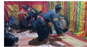
Gambar 3. Gerak Pilin Kirok Tangan

Kedua penari dengan posisi tubuh sedikit rendah, lutut di tekuk, dan satu tangan di angkat dengan telapak menghadap ke luar. Tangan tampak siap melakukan gerakan memutar atau memilin. Kemudian kedua tangan di rentangkan lebar ke samping, sejajar dengan bahu, posisi tetap rendah, lalu gerakan selanjutnya kedua tangan di depan dada atau pinggang, Gerakan tangan memutar berulang-ulang memutar ke arah dalam atau luar, telapak tangan menghadap ke atas atau ke depan, kemudian kaki di silang dan agak sedikit di tekuk. Gerakan dilakukan dengan hitungan 2 x 8, gerak dilakukan dengan rilis. Selesai melakukan gerak pilin kirok tangan dilanjutkan melakukan Gerak Kirok Alang Tabang Manjalang Gnuang.