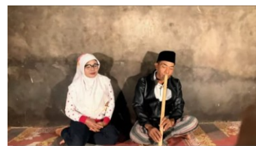
Gambar 1. 4 Pendendang dan Pemain Saluang Panjang