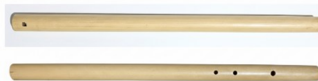
Gambar 1. 1 Saluang Panjang (Patiak Tigo) (Dokumentasi. Chairun Nisa 2026)

Saluang Panjang (Patiak Tigo) merupakan kesenian tradisional yang tumbuh dari kebiasaan hidup masyarakat Nagari Luak Kapau yang bermata pencaharian sebagai petani dan pengembala, yang tidak terdapat catatan tahun pasti mengenai awal kemunculannya. Instrumen ini dibuat dari bahan alami bambu jalau (jalar) yang digunakan sebagai saluang asok atau peniup api saat membakar ikan disela mengembala, yang menjadi gagasan awal terciptanya Saluang Panjang , hingga akhirnya mulai dipakai sebagai hiburan pribadi saat melepas lelah setelah melakukan pekerjaan masyarakat Luak Kapau. Awalnya Saluang Panjang memang untuk hiburan pribadi, namun seiring perkembangannya kesenian ini mulai ditampilkan pada acara adat, acara pernikahan, dan beberapa acara kenagarian lainnya.