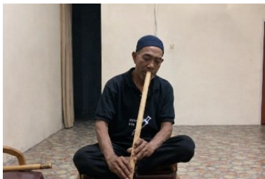
Gambar 1. 2 Posisi Bermain Saluang Panjang

Saluang Panjang diawali dengan posisi mulut yang diletakkan agak menyudut pada bagian peniup instrumen untuk mengarahkan aliran udara secara tepat ke bagian lidah sehingga menghasilkan getaran bunyi yang optimal. Teknik penjarian menggunakan kombinasi kedua tangan, yaitu dua jari tangan kiri (telunjuk dan tengah) untuk menutup dua lubang nada bagian atas, serta satu jari telunjuk tangan kanan untuk menutup lubang nada bagian bawah.