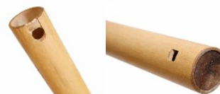
Gambar 1. 5 Bentuk Saluang Panjang Tradisional dan Modifikasi (Dokumentasi. Chairun Nisa 2026)

Dengan memodifikasi Bentuk peniup Saluang Panjang agar dapat mempermudah untuk belajar memainkan Saluang ini, termasuk upaya agar Saluang Panjang tetap beregenerasi. Dapat dilihat bentuk modifikasi kini lebih banyak digunakan oleh seniman, baik dalam konteks akademik maupun pertunjukan, tanpa menghilangkan karakter bunyi khas Saluang Panjang . Dokumentasi visual berikut ditampilkan untuk memperjelas perbedaan antara bentuk tradisional dan bentuk modifikasi pada bagian peniup.