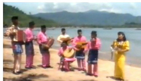
Gambar 1. Grup Gamad Budi Sejati

Sajian musik Gamad disusun berdasarkan kaidah adat " adaik bagamaik, gamaik baradaik " yang mengatur urutan, struktur musikal, serta etika pertunjukan. Pola penyajian ini bersifat relatif baku dan diwariskan secara turun-temurun, sehingga membentuk sistem pertunjukan yang tidak hanya musikal, tetapi juga merefleksikan nilai sosial masyarakat Pesisir Minangkabau.