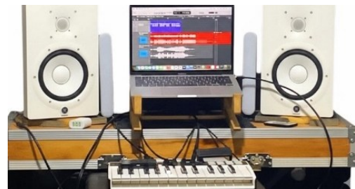
Gambar 3. Sequencer

Pemanfaatan instrumen digital juga menjadi bagian penting dalam transformasi garapan musik Gamad oleh Gamad Pituah Minang . Instrumen digital digunakan sebagai pendukung pengolahan bunyi melalui lapisan suara tambahan seperti penguatan atmosfer, harmoni, dan dinamika pertunjukan. Kehadiran teknologi digital tidak menggantikan peran instrumen utama Gamad, melainkan berfungsi memperluas spektrum bunyi dan memperkuat kualitas estetis sajian. Dengan demikian, instrumen digital berperan sebagai medium adaptasi yang menjembatani karakter tradisional Gamad dengan kebutuhan pertunjukan modern.