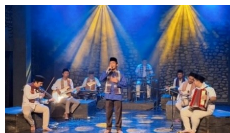
Gambar 1. Pertunjukan GPM di Festival Nan Jombang Tanggal 3 2025

Transformasi tersebut tercermin secara konkret dalam praktik Grup Gamad Pituah Minang (GPM). Kelompok ini mempertahankan identitas dan struktur dasar Gamad, namun melakukan penyesuaian melalui pemangkasan durasi pertunjukan, pengembangan aransemennya, penambahan instrumen modern, serta pemanfaatan media digital. Pada aspek vokal dan artistik, penyajian Gamad kontemporer menunjukkan kebebasan yang lebih besar dalam pengolahan gaya vokal, penggunaan teknologi panggung yang lebih modern. Selain itu, pemanfaatan platform digital memperluas ruang pertunjukan Gamad sebagai media hiburan, edukasi, dan transmisi budaya di era digital.