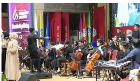
Gambar 3. Penampilan Grup Gamad Salendang Banang Ameh dalam Pertunjukan Orkestra dari UNP

Transformasi Gamad juga merambah ranah pendidikan formal. Seperti di Universitas Negeri Padang (UNP) dan Institut Seni Indonesia (ISI) Padang Panjang, Gamad mulai diajarkan di perguruan tinggi seni sebagai bagian dari kurikulum, mencakup pemahaman struktur lagu, teknik vokal, penggunaan instrumen, serta praktik pertunjukan. Kehadiran Gamad dalam institusi pendidikan menunjukkan adanya pengakuan akademik terhadap nilai estetis, historis, dan kultural Gamad, sekaligus menjadikan pendidikan sebagai sarana pelestarian dan ruang transformasi kreatif agar Gamad tetap relevan bagi generasi muda.