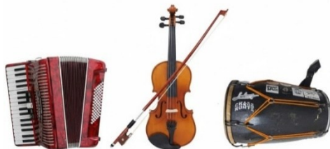
Gambar 2. Instrumen Khas Musik Gamad

Struktur lagu Gamad secara konvensional terdiri atas tiga bagian pokok yang bersifat baku, yaitu senter , anta japuik , dan pangunci . Senter berperan sebagai bagian pembuka yang menyajikan melodi-melodi khas Gamad serta membangun suasana awal pertunjukan. Anta japuik atau pintu lagu berfungsi sebagai penghubung yang mengantarkan dari bagian pembuka menuju inti lagu. Adapun pangunci merupakan bagian penutup yang dimainkan pada akhir sajian untuk menegaskan penyelesaian lagu. Ketiga bagian ini tidak hanya berfungsi sebagai susunan teknis dalam komposisi lagu, tetapi juga sebagai penanda estetis dan identitas musikal yang membedakan Gamad dari bentuk musik lainnya.