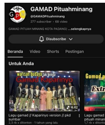
Gambar 7. Akun Youtube Grup Gamad Pituah Minang

Seiring perkembangan teknologi, penyajian Gamad tidak lagi terbatas pada ruang pertunjukan langsung, tetapi mengalami perluasan medium melalui platform digital . Digitalisasi membuka ruang baru bagi kesenian Gamad untuk menjangkau audiens yang lebih luas melalui media daring seperti YouTube, Tiktok dan Instagram. Perubahan medium ini tidak hanya berdampak pada distribusi, tetapi juga mendorong penyesuaian bentuk penyajian agar sesuai dengan karakter audio-visual media digital.