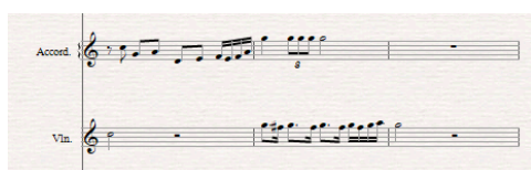
Gambar 4. Partitur Anta Japuk Pada Lagu "Mati Dibunuh"

Senter berperan penting sebagai pintu masuk pendengar ke dalam karakter lagu, sehingga penggarapannya dilakukan secara cermat agar nuansa khas Gamad dapat tersampaikan sejak awal.