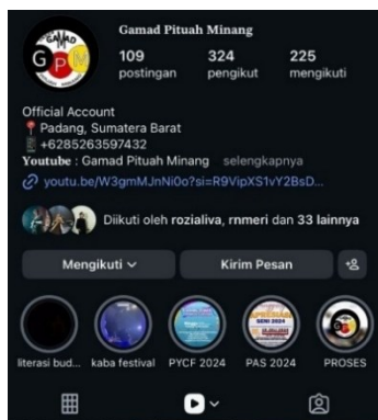
Figure 9. Akun Instagram Grup Gamad Pituah Minang

Fenomena tersebut tampak pada praktik Gamad Pituah Minang (GPM) yang secara konsisten memanfaatkan platform digital sebagai sarana penyajian dan distribusi pertunjukan Gamad. Dalam konteks digital, GPM tidak sekadar mendokumentasikan pertunjukan, tetapi mengembangkan konsep sajian yang lebih komunikatif melalui pengemasan audio-visual, penataan tata panggung, serta pengolahan tata suara digital. Instrumen tradisional tetap menjadi pusat musikal, namun dipadukan dengan teknologi rekaman, mixing, dan mastering modern untuk meningkatkan kualitas bunyi dan daya tarik sajian.