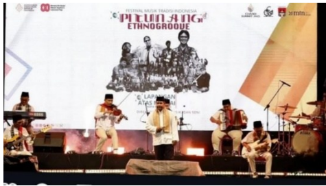
Gambar 6 Penampilan Grup GPM pada Festival Musik Pitunang Ethnogrove 2025

Musik Gamad merupakan salah satu bentuk seni pertunjukan masyarakat Pesisir Kota Padang yang memadukan unsur musikal Minangkabau dengan pengaruh Barat. Dalam konteks pertunjukan langsung ( live performance ), Gamad tidak hanya berfungsi sebagai hiburan, tetapi juga sebagai medium ekspresi sosial dan budaya. Sajian pertunjukan Gamad ditandai oleh permainan instrumen melodis seperti biola, gitar akustik, dan akordeon sebagai pembuka suasana, yang kemudian diikuti oleh vokal dengan pantun pembuka sebagai bentuk salam dan pengantar pertunjukan. Interaksi musikal berkembang secara dialogis melalui tradisi berbalas pantun yang spontan, sejalan dengan prinsip " adaik bagamaik, gamaik baradaik ", sehingga pertunjukan Gamad bersifat komunikatif, kolektif, dan dinamis.