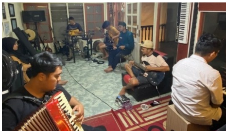
Gambar 2. Proses Kreativitas oleh Grup Musik Gamad Pituah Minang

Garapan musik dalam kesenian Gamad merupakan hasil dari proses kreatif seniman dalam merespons perubahan konteks sosial, media pertunjukan, dan selera audiens. Pada praktik Gamad Pituah Minang (GPM), garapan musik menjadi ranah utama terjadinya transformasi, di mana unsur-unsur musikal tradisional tidak hanya dipertahankan sebagai warisan, tetapi diolah kembali secara kreatif agar tetap relevan dengan kebutuhan pertunjukan modern. Proses ini menunjukkan adanya kesadaran estetis dan strategis pelaku seni dalam menempatkan musik Gamad sebagai kesenian yang adaptif terhadap perubahan zaman tanpa melepaskan identitas kulturalnya.