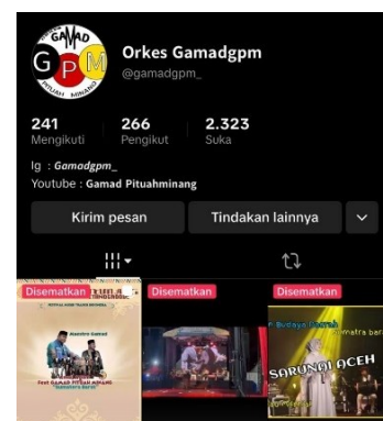
Gambar 8. Akun Tiktok Grup Gamad Pituah Minang