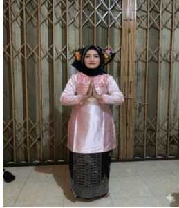
Gambar 1. Gerak Sambah