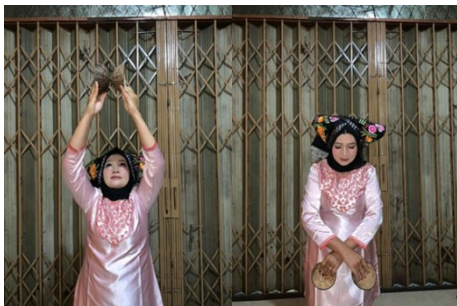
Gambar 3. Gerak Tungku Sajaringan

Gerakan ini melambangkan tiga unsur kepemimpinan dalam masyarakat minangkabau, yang melambangkan keseimbangan, kedamaian serta kolaborasi antara tiga unsur tersebut. Gerakan ini membenturkan kelapa keatas dan kebawah lalu mengangkat kaki secara bergantian.