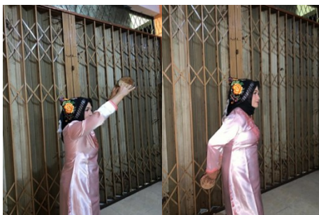
Gambar 7. Gerak Kejar-kejaran

Gerakan ini menggambarkan kelincihan, keceriaan serta interaksi dalam menari. Gerakan ini penari berurutan sambil berlari kecil dan membenturkan tampuruang sesuai irama musik.