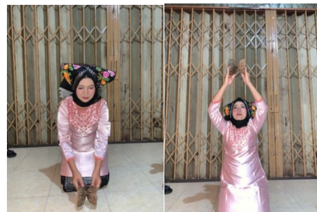
Gambar 5. Gerak Manampi

Tarian ini dominan memiliki gerak yang tegas, lincah dan dinamis. Dengan langkah maju, serta langkah surut. Gerakan ini yaitu membenturkan tampuruang keatas dan kebawah kaki yang diangkat.