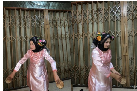
Gambar 4. Gerak Manumbuk Padi

Gerakan ini menggambarkan kegembiraan, semangat dan kekuatan dalam menyambut musim panen. Ragam gerak ini dikombinasikan dengan teknik rantak, dimana kaki diangkat dan dirantak serta tangan membenturkan tampuruang secara berulang sesuai.