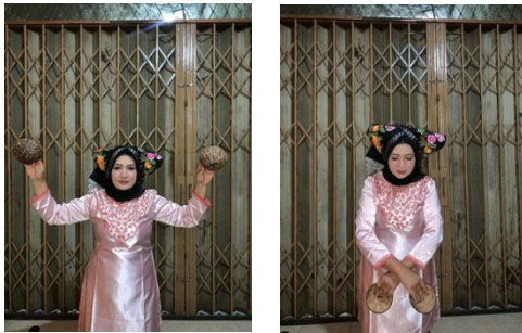
Gambar 2. Gerak Alang Tabang

Gerak Alang Tabang melambangkan kegembiraan dan kebahagiaan. Gerakan ini berada di awal tarian agar dapat di perlihatkan kebahagiaan dalam menyambut hasil panen. Gerakan ini merentangkan tangan serta melambai seperti elang yang sedang terbang. Gerakan ini tidak memiliki pengulangan dengan jumlah gerakan 2x8.