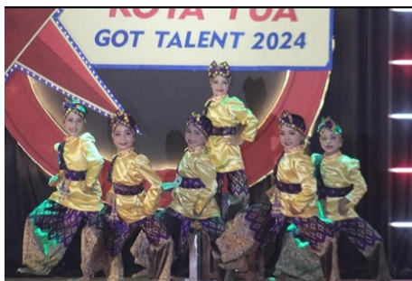
Gambar 4. Dokumentasi lomba