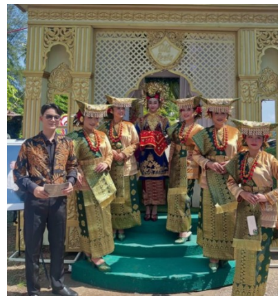
Gambar 10. Dokumentasi acara wedding

dan kebutuhan konsumen. Peluang besar muncul di pesta pernikahan yang dihadiri pejabat atau tamu penting. Dengan penampilan terbaik, mereka cenderung memilih kembali jasa sanggar tersebut. Selain itu, untuk memperlancar pemasaran, Sanggar Galatiak Minang bekerja sama dengan penyedia pelaminan, dan gedung acara, membangun relasi agar konsumen merasa praktis terutama di era saat ini di mana masyarakat mengutamakan kemudahan dengan kualitas unggul. Sanggar juga mempromosikan hasil produksinya melalui media sosial, serta jingle suara yang dibacakan MC di resepsi pernikahan dan event lainnya.