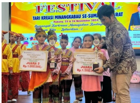
Gambar 3. Dokumentasi Juara 1 &amp; 2 prestasi yang diraih oleh anak sanggar galatiak minang