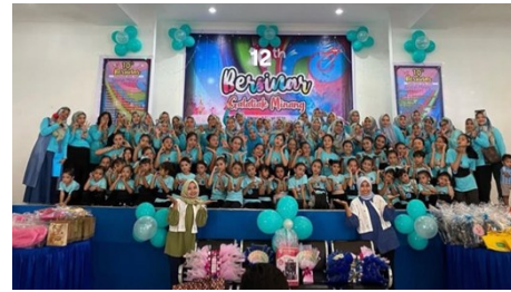
Gambar 6. Dokumentasi sanggar galatiak minang mengadakan lomba tari se-Sumatera Barat