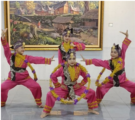
Gambar 8. Jasa karya tari baru untuk FLS3N