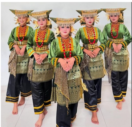
Gambar 9. Jasa sewa kostum