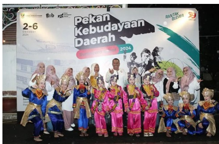
Gambar 5. Dokumentasi diundang tampil di acara pekan kebudayaan daerah