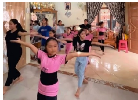
Gambar 1. Kegiatan latihan per-tingkatan

Di sanggar tari Galatiak Minang terdapat tiga tingkatan peserta didik. Tingkat pertama yaitu tingkat A (pemula) yang terdiri dari anak usia dini berumur antara 3-6 tahun, di kelas pemula ini diajarkan gerak-gerak dasar tari. Kemudian yang kedua tingkat B yang terdiri dari anak-anak berumur 7-12 tahun, yang mana mempelajari setingkat lebih tinggi dari kelas pemula, seperti teknik tari dan teknik olah tubuh, dan yang ketiga yaitu tingkat C yang terdiri dari anak-anak remaja yang berumur 13-17 tahun, di kelas ini lebih mengajarkan tata cara menari power yang kuat, fokus, serta merasakan irama tempo musik yang tepat.