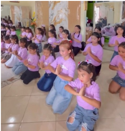
Gambar 2. Dokumentasi latihan gabungan