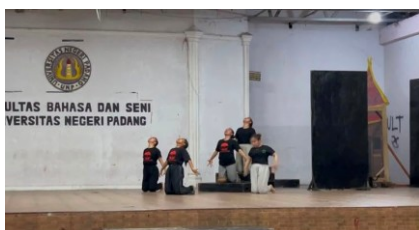
Gambar 1. Eksplorasi gerak tari oleh penari

Dalam proses ini Penata sempat menghadapi tantangan berupa heterogenitas kemampuan fisik dari masing masing penari serta kurangnya pendalaman atau penghayatan adegan magis yang menekankan ketakutan sampai ke adegan kesurupan/kerasukan. Permasalahan ini penata tari yang diatasi melalui metode peragaan ragam gerak secara lebih intensif.